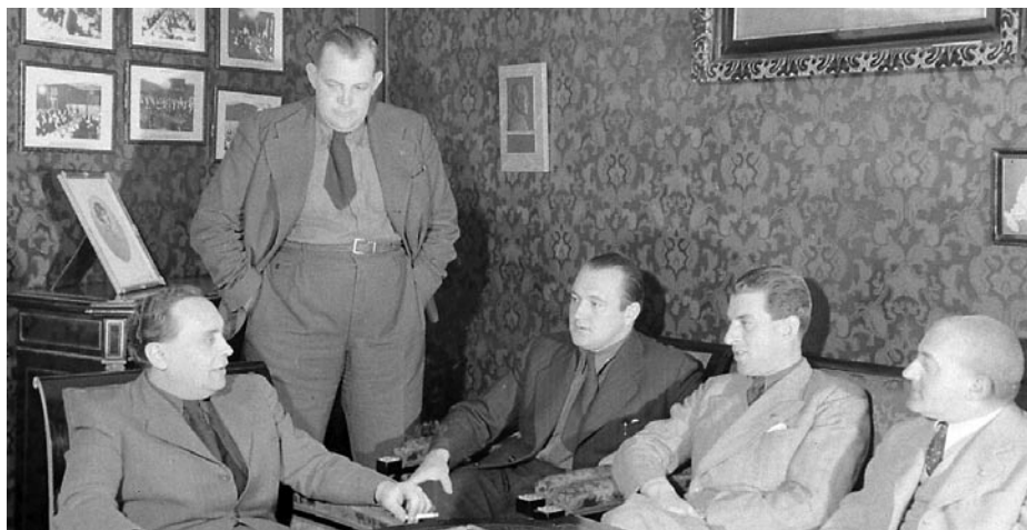
SZÁLASI ÉS „MUNKATÁRSAI”

A nyilasok különösen nagy sikert érnek el a hivatali értelmiség soraiban. A közülük beszervezettek titkos párttagságot kapnak, a titkos párttagokat szakmai csoportokba szervezik és tízes egységekben („tized”, „tízek tanácsa”, „nemzetiség”) tartják nyilván. Emellett, illetve a titkos párttagok szervezete felett létezik a „hűséggyűrűsök” köre, akik csak Szálasinak tartoznak elszámolási kötelezettséggel. A nyilasok más pártoktól eltérően előszeretettel szervezik be a nőket.