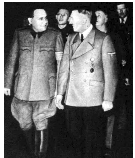
SZÁLASI ÉS HITLER

1920-ban bevezeti az ún. numerus clausus törvényt. Ez előírta, hogy az egyetemeken tanuló fiatalok összetételének meg kell felelni az egyes felekezetek, ill. népcsoportok össznépszerűségeen belüli arányának. Bár a törvényt 1928-ban enyhítik, a zsidó vallású egyetemisták aránya ezt követően is csak 10–12 százalék körül mozgott, szemben a háború előtti 30–34 százalékkal. 1938-tól kezdődően további zsidóellenes törvényeket fogadnak el. Az ún. I. zsidótörvény (1938. évi XV. tc.) 20 százalékban maximálja az üzleti és kereskedelmi alkalmazottak, valamint a különböző értelmiségi pályák izraelita vallású tagjainak a számát. A II. zsidótörvény (1939. évi IV. tc.) az iparban és a kereskedelemben 12 százalékos, az értelmiségi pályákon 6 százalékos, az állami alkalmazottak körében pedig 0 százalékos kvótát állapít meg. A törvény szerint zsidónak az minősül, akinek legalább egyik szülője vagy két nagyszülője izraelita vallású. A III. zsidótörvény (1941. évi XV. tc.) megtiltja a zsidók és nem zsidók közötti házasságkötést és az azon kívüli nemi kapcsolatot is. A IV. zsidótörvény (1942. évi XV. tc.) értelmében zsidók a